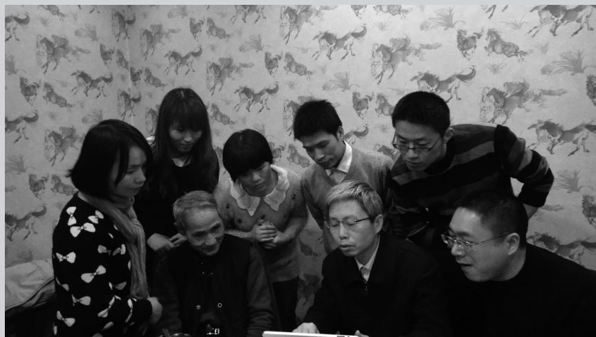
2013年1月29日晚上，部分写作协会会员、太阳潮诗社社员举行冬日小聚，学习交流诗词创作。