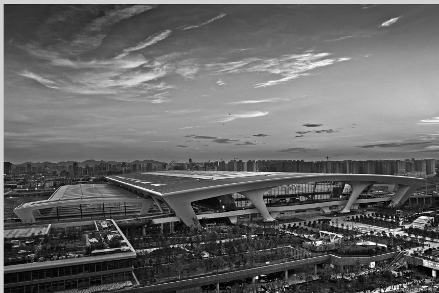
杭州火车东站（浙建集团浙江建工总承包施工，中国建设工程鲁班奖）