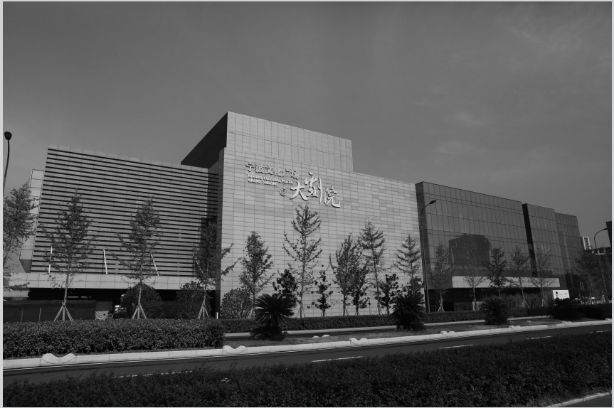
宁波文化广场大剧院（浙建集团浙江二建总承包施工，中国建设工程鲁班奖）