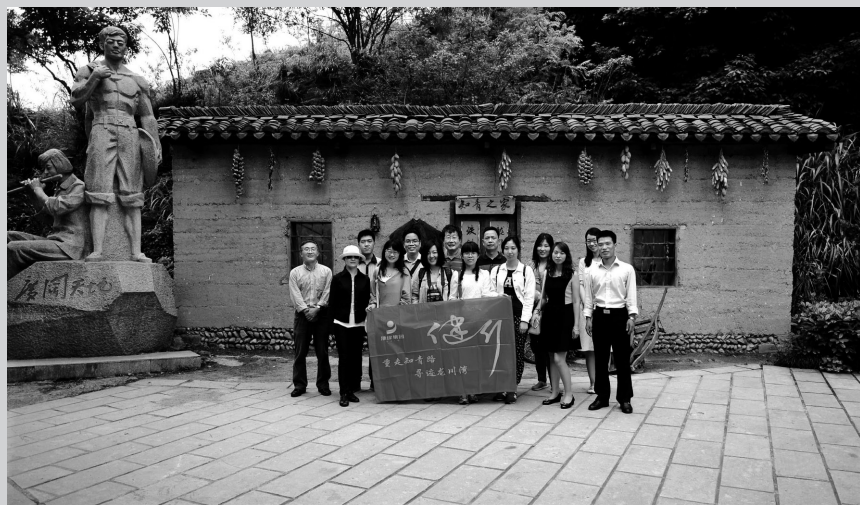
2014年5月24日，集团写作协会会员、太阳潮诗社社员在千岛湖龙川湾寻访知青足迹。